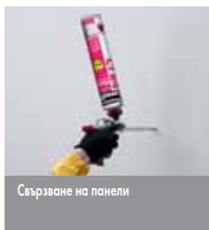
Съвързване на панели