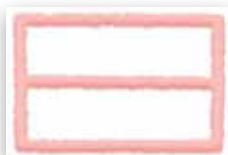
Фиксиране на полистирен във фасадна топлоизолационна система - покривност до 10 \text{ m}^2 с един флакон