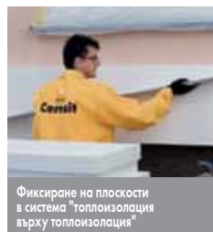
Фиксиране на плоскости в система "топлоизолация върху топлоизолация"