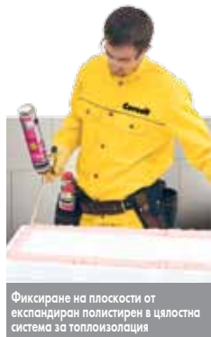
Фиксиране на плоскости от експандиран полистирен в цялостна система за топлоизолация